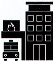
Direction du SDIS 31 Colomiers